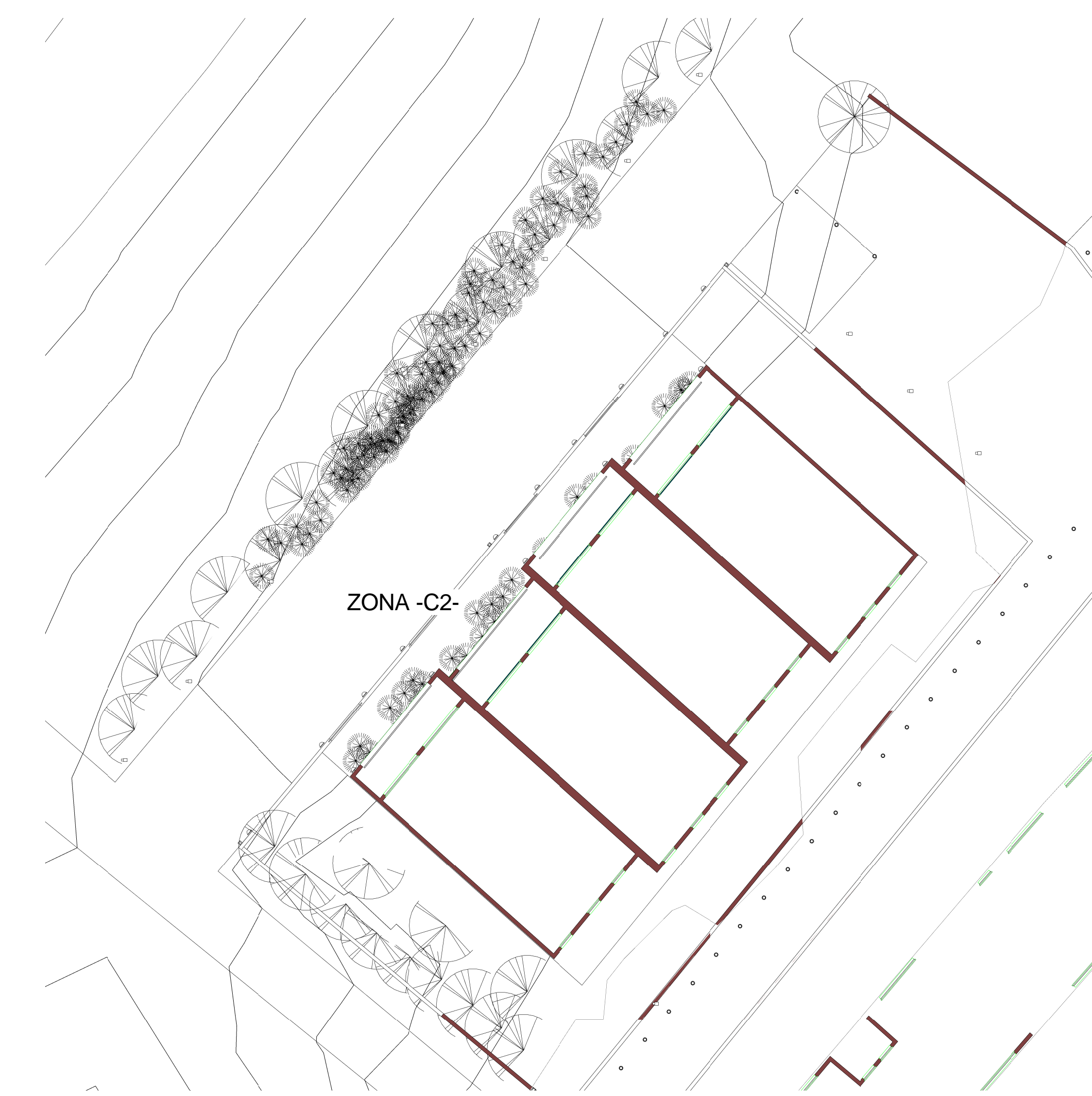
PLANIMETRIE MURATURE IN PROGETTO UNITA' EDILIZIA A SCHIERA ZONA -C2- PIANO TERRA- SEZIONE 01