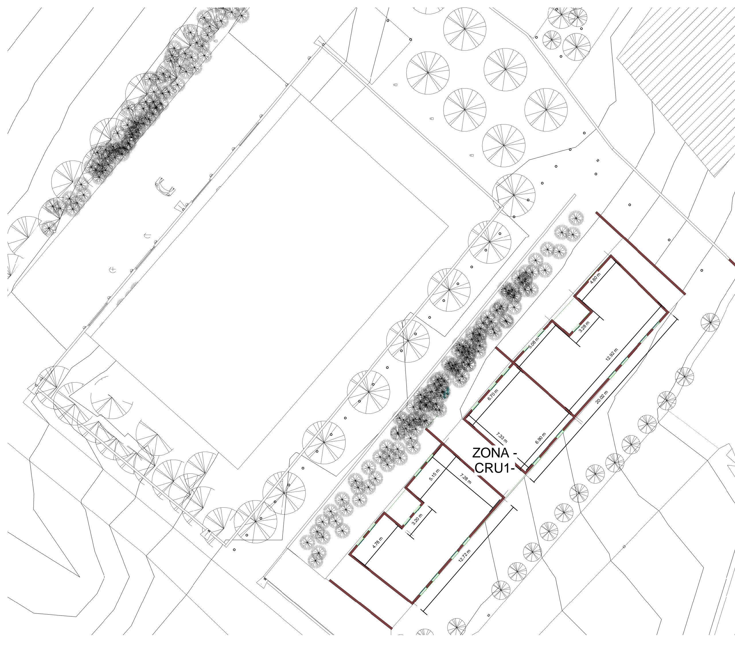
PLANIMETRIE MURATURE IN PROGETTO UNITA' EDILIZIA A SCHIERA ZONA -CRU1- PIANO TERRA -SEZIONE 02